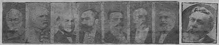
Thiers 1871-1873 Mahon 1873-1879 Grévy 1879-1907 Carnot 1887-1894 Périer 1894 Faure 1895-1909 Loubet 1899-1906 Fallières 1906-1913

Mr. RAIMUNDO POINCARÉ Presidente actual de la República Francesa Electo en 1913. Nació en Bar Le Duc en 1860 Al dejar la Presidencia de la República pasará a ejercer la de la Cámara de Senadores